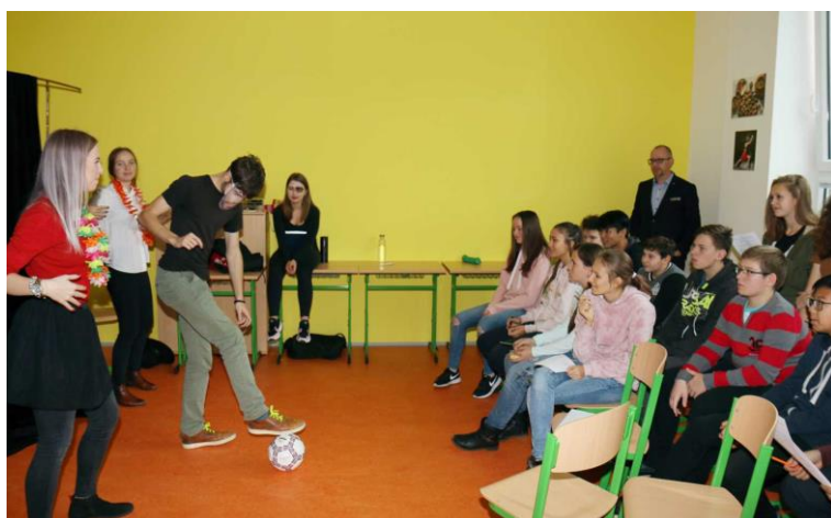
Projektový den pro partnerské ZŠ

Od září 2018 probíhá v učebnách pravidelná výuka, nové učebny školy velmi pomohly zkvalitnit výuku a zmírnit prostorové problémy gymnázia.