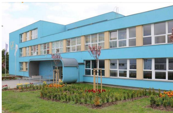
Zabradní úpravy před školou

Středoškolským klubem při gymnáziu tradiční červnová výstava v atriu školy, tentokrát s tematikou optických jevů, hvězd a polárních září s názvem Obloha .