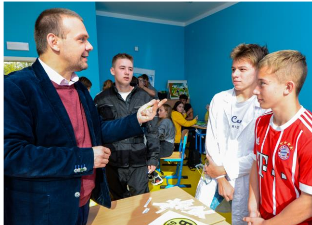
Slavnostní otevření pavilonu jazyků