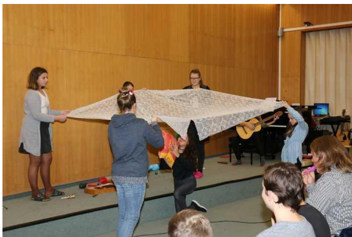
Kapr pod zamrzlou hladinou (Vánoční koncert)

Divadelní soubor IDI klub (IDI = improvizace, divadlo, interpretace) se nejprve v říjnu zúčastnil nesoutěžního minifestivalu v Plané, zahráli jsme loňskou inscenaci: Řvi potichu, brácho a opět dojali některé dívky a ženy v publiku. Pak jsme v počtu hojném navštívili podzimní Improslet, kde jsme rozvíjeli své dovednosti improvizací a pokračovali v tom do prosince. Ukázky improher a kategorií improligy jsme předvedli při vánočním programu, vernisáži výstavy Obloha v atriu gymnázia i na Večírku GFK. Příští rok již máme domluvený i zápas Improligy s Pilulkami z Prachatic.