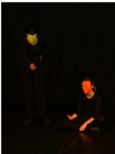
Sen číslo 1, o nespravedlnosti (Večírek GFK)