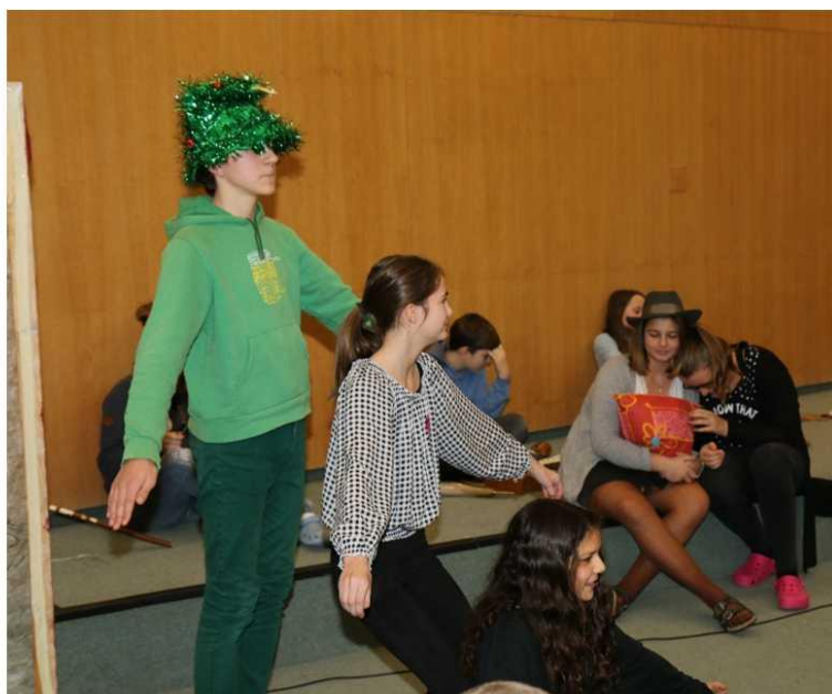
Idyla u vánočního stromku (Vánoční koncert)

Divadelní soubor IDI klub (IDI = improvizace, divadlo, interpretace) se nejprve v říjnu zúčastnil nesoutěžního minifestivalu v Plané, zahráli jsme loňskou inscenaci: Řvi potichu, brácho a opět dojali některé dívky a ženy v publiku. Pak jsme v počtu hojném navštívili podzimní Improslet, kde jsme rozvíjeli své dovednosti improvizací a pokračovali v tom do prosince. Ukázky improher a kategorií improligy jsme předvedli při vánočním programu, vernisáži výstavy Obloha v atriu gymnázia i na Večírku GFK. Příští rok již máme domluvený i zápas Improligy s Pilulkami z Prachatic.