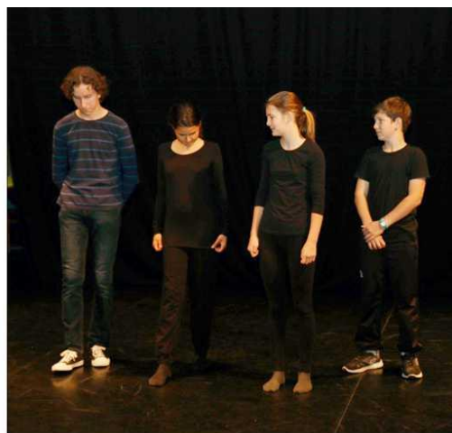
Stydím se, bojím se, nenávidím (Večírek GFK)

V prosinci jsme také začali pracovat na inscenaci HEXAFOR (Zlatý kolovrat). 8. – 11. března proběhlo v Úborsku soustředění, na kterém pracovalo 11 studentů se mnou a Terezkou Stupkovou. Kromě zkoušení jsme vyráběli maketu a zmenšené podoby loutek, četli si další Erbenovy balady, zpívali, lehce improvizovali a hráli ping-pong (venku bylo, bohužel, příšerně, takže aktivity v přírodě jsme odložili na jindy).