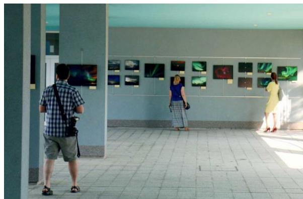
Výstava Obloha v atriu školy

Podařilo se podpořit i nejrůznější kroužky pracující při škole – kroužky základní školy, sportovní, divadelní, pěvecký sbor. Z grantu na podporu technického vzdělání byly pořízeny nové pomůcky pro fyziku (např. pomůcky pro modelování magnetického pole, výkonný laser, žákovské laboratorní pomůcky ...).