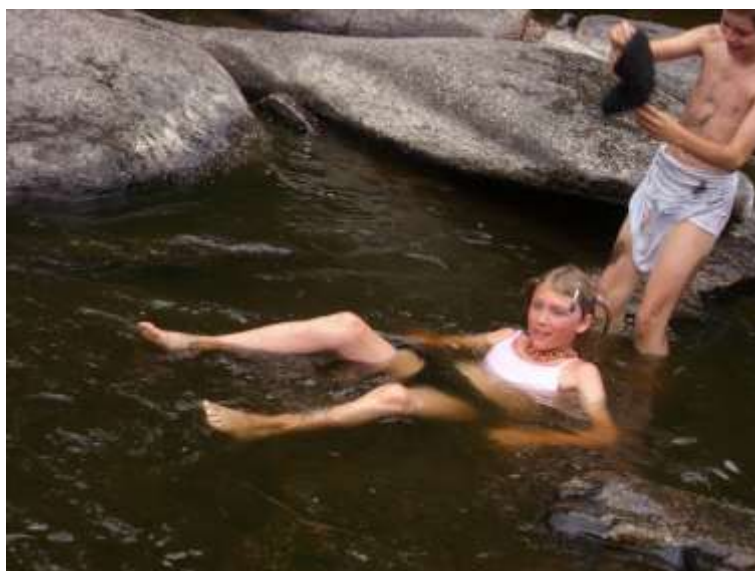
Řeka bavila, chladila i inspirovala