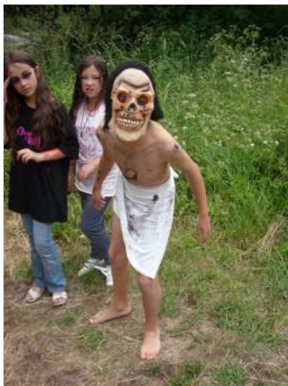
Skřet v akci