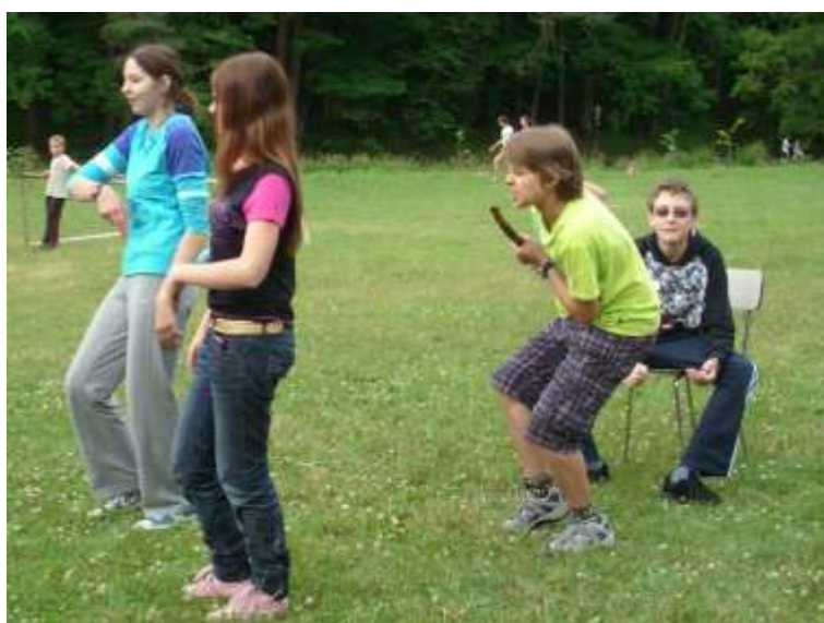
Úspěšný taneční videoklip