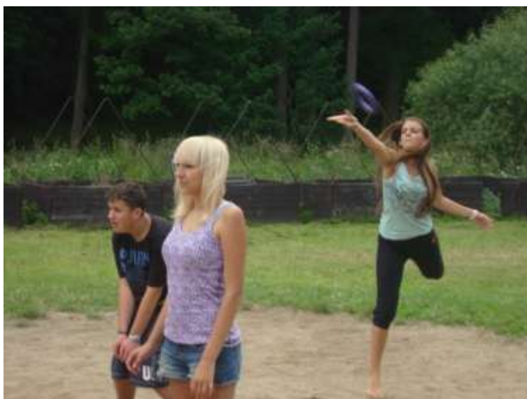
Našel se čas i na sport