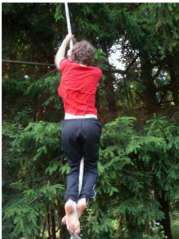
Obětaví byli kaskadéři