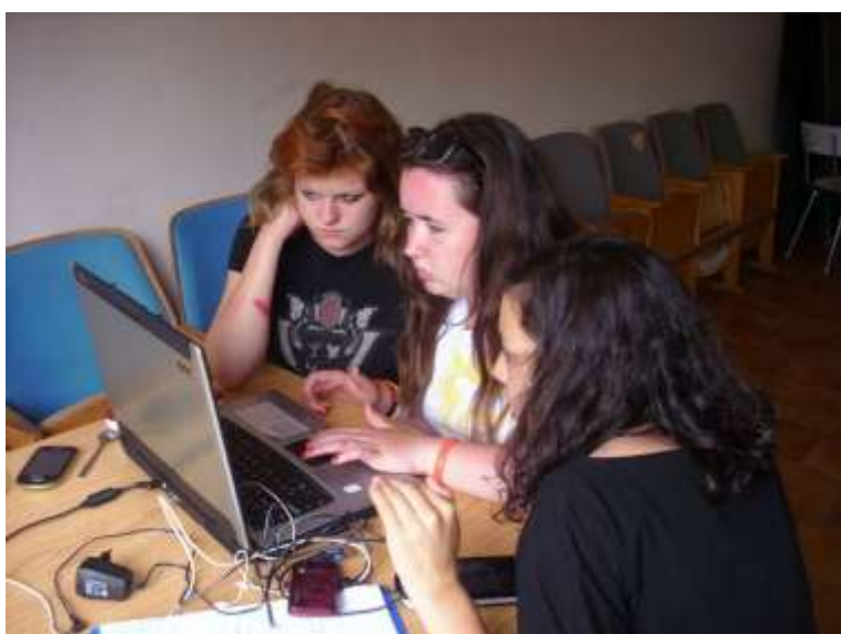
Ve střížně se pracovalo téměř profesionálně