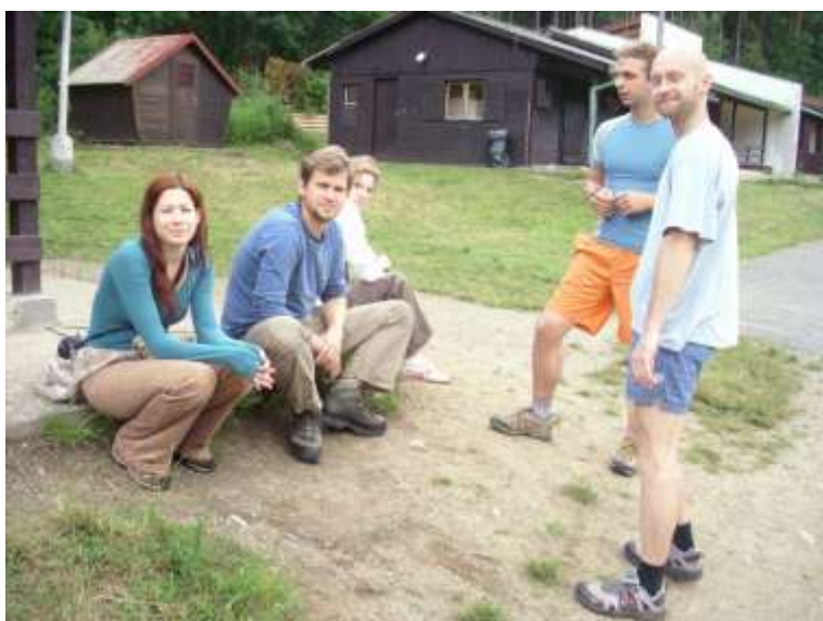
Tým šéfproducentů (neúplný)