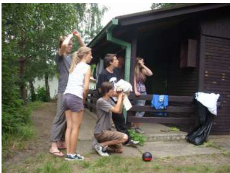
Filmový štáb při práci