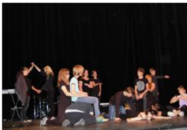
Zatímbezejména: Příběh strýce Montegauea