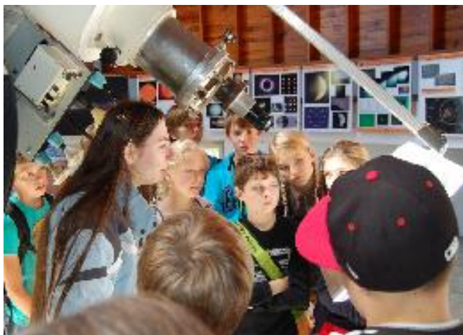
Observatoř na Kleti