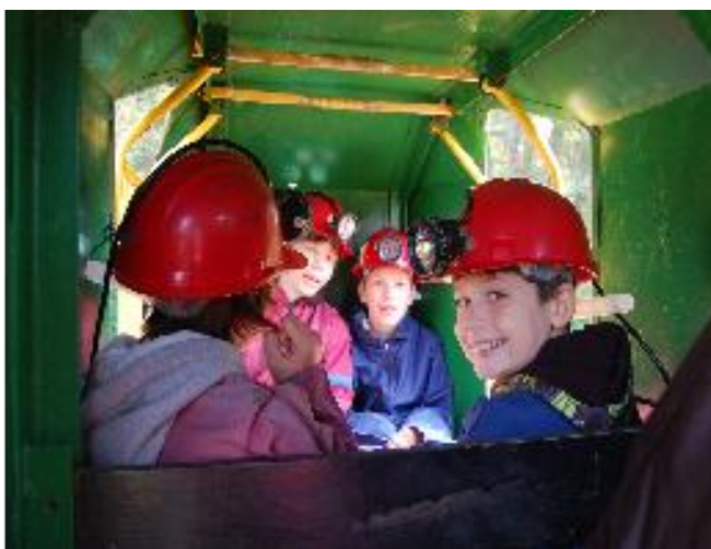
Vláčkem do grafitového dolu