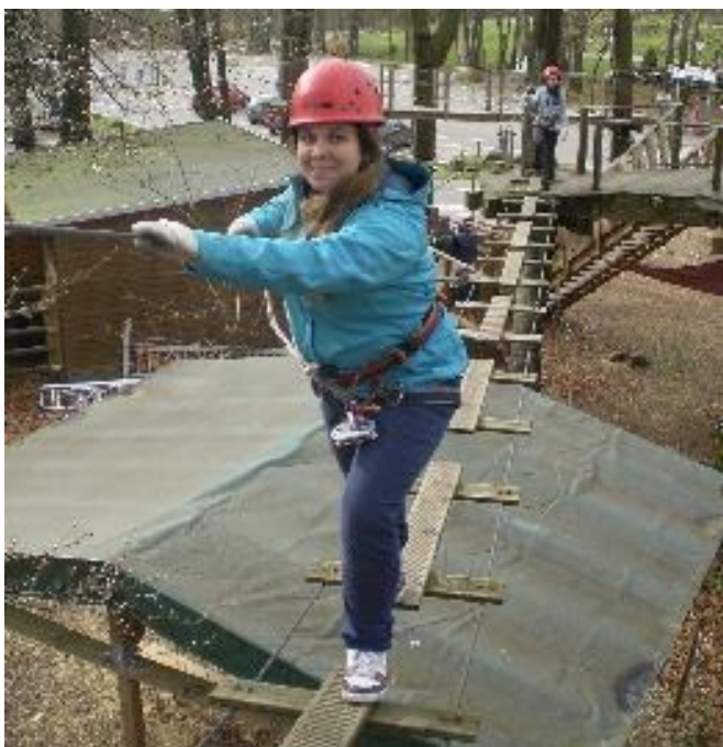
V lanovém centru

nás proto nevítal velký zástup žáků a rodičů, který tam vsuktu byl o hodinu dříve. Museli jsme upravit program prvního odpoledne, ale myslím, že to nikomu nevadilo.