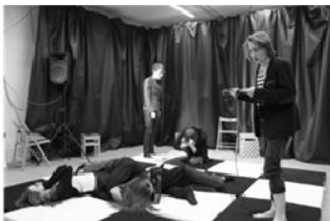
Sedum divů světa: Punk-rock

Pro divadelníky a milovníky divadla byl tento školní rok, dá se říci, veleúspěšný.