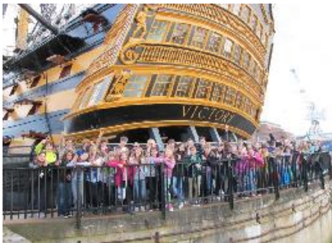
Studenti GFK u H. M. S. Victory v Portsmouth