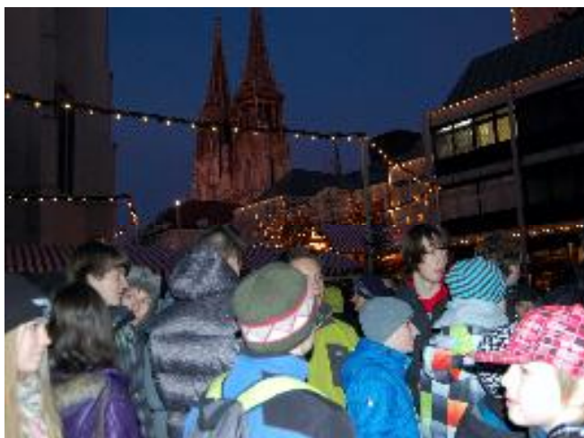
Advent v Regensburgu