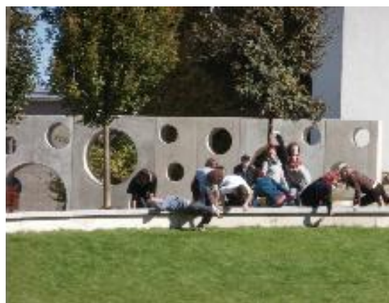
PS: Na následných trénincích jsme si to navzájem ukazovali.