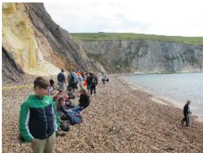
Oběd na Isle of Wight