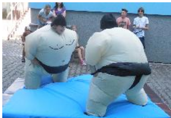
Tradiční školní jarmark – letos se zápasy sumo

Sekundy a tercie se v den předávání vysvědčení (30. 1.) vydaly do multikina Cinema City na film Zlodějka knih, kvinta viděla Film jako Brno od společnosti Člověk v tísni na nádraží Plzeň – Jižní předměstí a studenti tercie, kvarty a celého vyššího gymnázia viděli v aule školy slavnou Menzelovu adaptaci Hrabalovy povídky Ostře sledované vlaky.