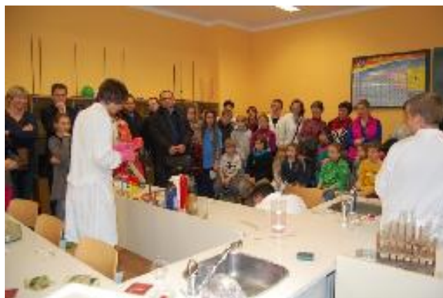
Klíče od GFK