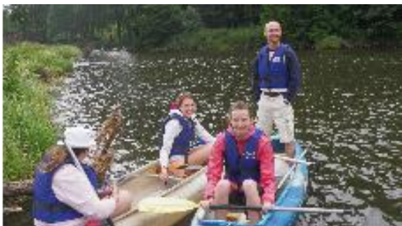
Škola v přírodě – kvarta GFK na vodě

Středoškolský klub se v minulých letech podílel na kulturních akcích – byl spolupředatelem velkého projektu o bývalém absolventovi školy akademickém malíři Bohumilu Konečném – Bimbovi.