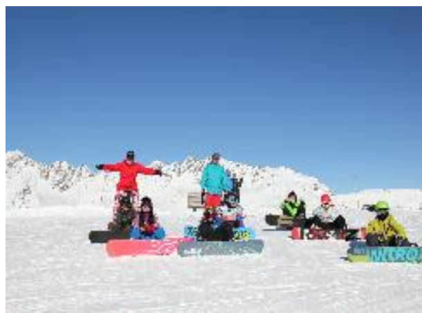
Lyžařský kurz sekundy v Alpách