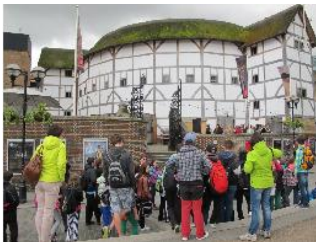
GFK před divadlem W. Shakespeara the Globe

V pátek jsme cestovali do vnitrozemí za historickými památkami. Dopoledne jsme se nechali očarovat mystickým Stonehenge, což zanechalo v dětech velké dojmy. Odpoledne jsme strávili ve městě Bath, kde jsme nevynechali prohlídku historických lázní a centra města. Znavení a plni zážitků jsme se vydali naposled do našich anglických rodin.