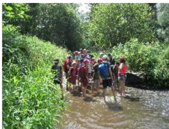
Tábor na Střele